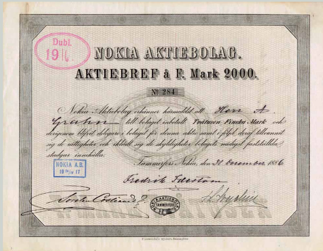
Nokian vuoden 1886 osakekirjan kannessa näkyy osakeantileimauksia. Keskellä allekirjoittajana Nokian perustaja Fredrik Idestam omakätisesti.